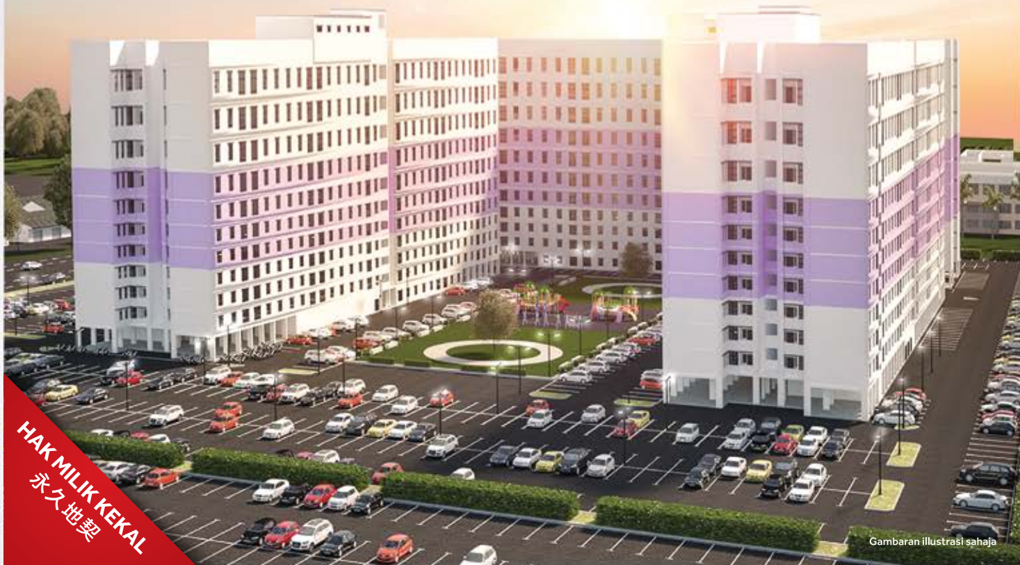
Gambaran ilustrasi sahaja