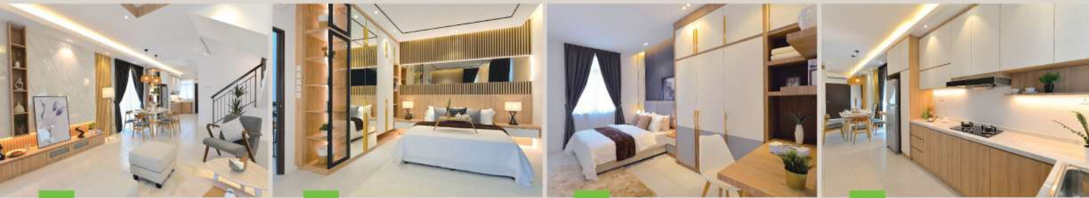
Ruang Tamu 客厅

Rumah Contoh Sedia Dikunjungi - 欢迎参观示范单位 -