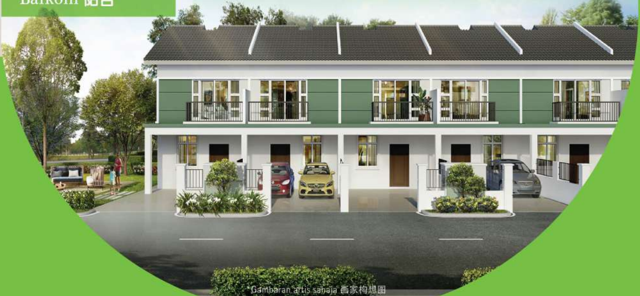
Gambaran artis sahaja 画家构想图