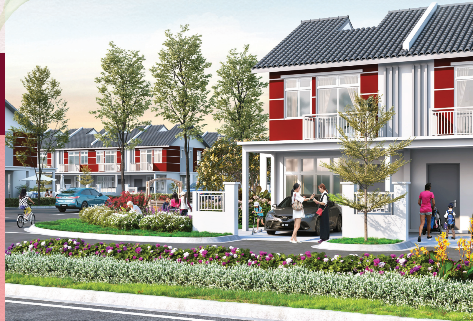
Gambaran Artis Sahaja 画家构想图

IKLAN INI TELAH DILULUSKAN OLEH JABATAN PERUMAHAN NEGARA. MAKLUMAT PEMAJUAN DAN IKLAN YANG DILULUSKAN BOLEH DISEMAK DI PORTAL TEDUH.KPKT.GOV.MY