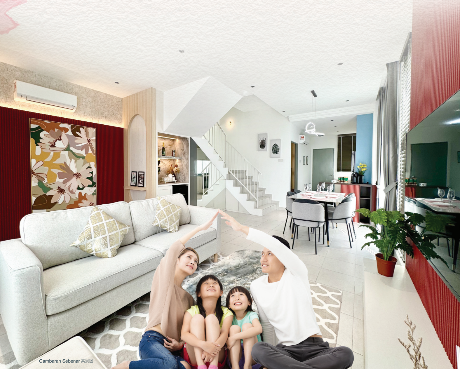
Gambaran Sebenar 实景图