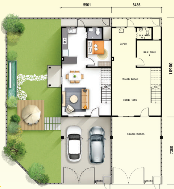
TINGKAT BAWAH RUMAH TERES 2 TINGKAT