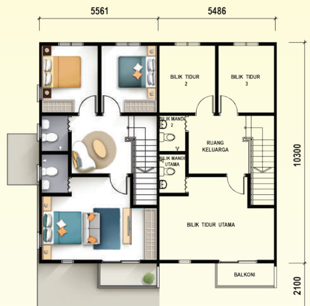
TINGKAT ATAS RUMAH TERES 2 TINGKAT